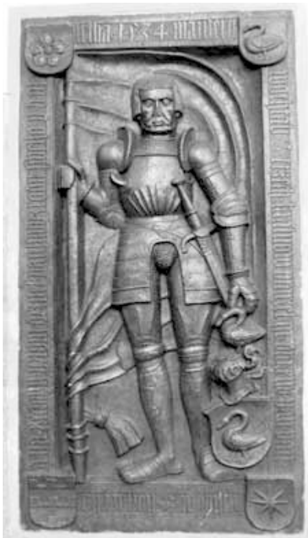
Náhrobník Kryštofa ze Švamberka (+1534), klášterní kostel Nanebevzetí P. Marie, Bechyně.