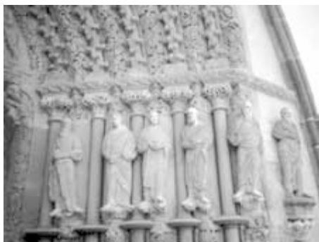
Tišnov-Předklášteří, klášterní kostel cisterciáček Porta coeli, jižní ostění slavnostního portálu, sochy se štukovými mladšími doplňky. Stav před konečnou retuší.

bádání vracel a vrací, zejména v perspektivě hořké historické zkušenosti s vývojem uměleckých avantgard, s jejich utopiemi a jejich selháním nebo krizí ve vztahu k totalitním systémům 20. století.