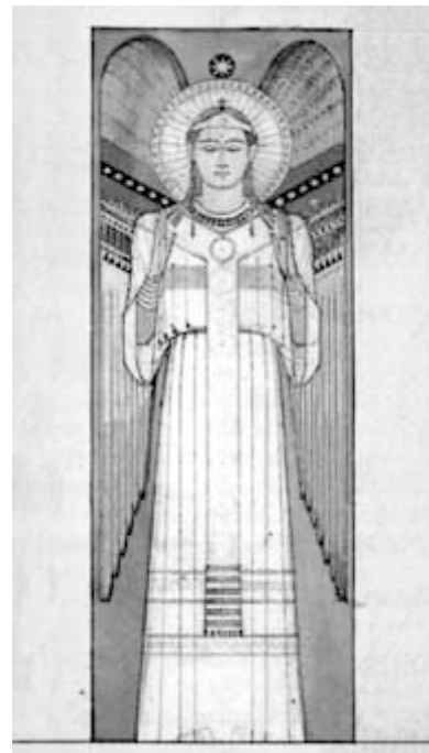
Desiderius Lenz, Návrh fresky, 1874, Arciopatství Beuron