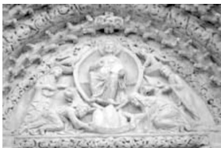
Tišnov-Předklášteří, klášterní kostel cisterciáček Porta coeli, tympanon slavnostního portálu.

V letech 2000-2002 proběhlo restaurování hlavního portálu kostela Nanebevzetí Panny Marie v Předklášteří u Tišnova, jediného dochovaného středověkého portálu katedrálního typu u nás s figurální výzdobou v ostění. Zakladatelkou kláštera cisterciáček po r. 1230 byla královna Konstancie Uherská, druhá manželka Přemysla Otakara I., matka sv. Anežky a Václava I., který je patrně též zobrazen spolu s matkou v tympanonu portálu, provedeného před rokem 1240. Projekt restaurování byl umožněn díky grantu od nadace World Monuments Fund za příspěví nadace Samuela H. Kresse.