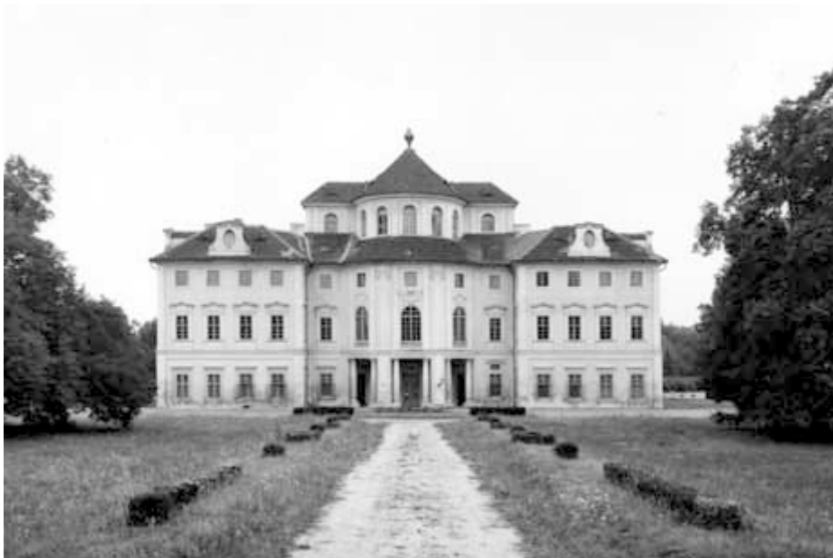
Pohled na barokní zámek v Liblicích

jak známo spláchly Prahu ze zemského povrchu. V instrukcích pro místní lektory jsem se pokusil vysvětlit, že Čechy nejsou pouze Praha a že „Československo“ (pojem Česká republika Francouzi naprosto nic neříká) se neskládá pouze z Čech. Nepovedlo se. Pouhé dva dny poté jsem mohl na vlastní uši slyšet milou průvodkyni, jak vypráví u skupiny z kalvárie v Králíkách (dnes ve Vraclavi) že je to velká vzácnost z jednoho pražského kostela, jediného, který nebyl zničen při povodních. Francouzský kolega přijel nadšený z výstavy v Rennes a dvě hodiny mi o ní vyprávěl. Na závěr mi pak položil dotaz: „A nevíš prosím tě, kde ta Morava je?“ Rád by se tam podíval, ale časový posun a nepohodlí celodenního letu ho prozatím od tohoto úmyslu odrazují. Za Rýnem už nežijí jenom lvi, ale toto poznání se prosazuje velmi ztuhla.